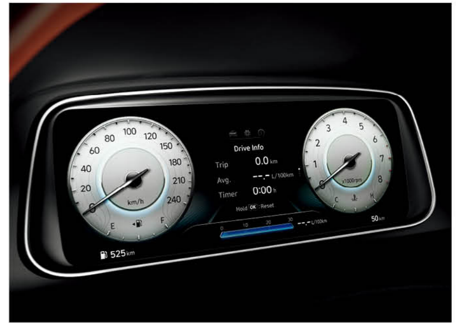
مجموعة عدادات LCD TFT مقاس 10.25 بوصة