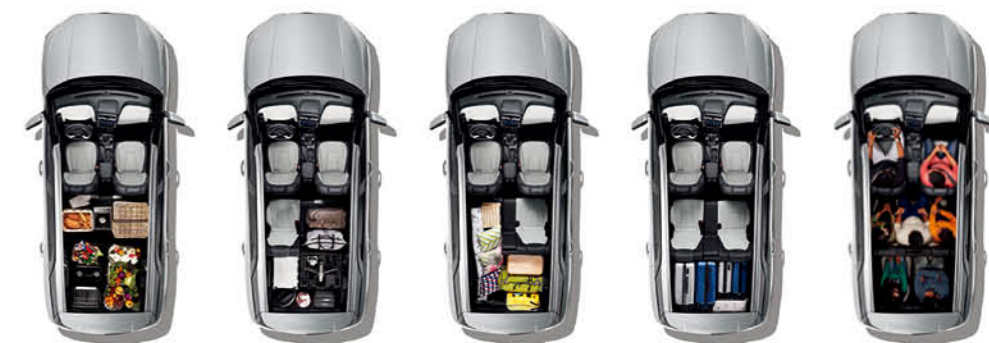
7 مقاعد مقاعد الصف الثالث مطوية مقاعد الصف الثاني مطوية مقاعد الصف الثالث مطوية بنسبة 40% مقاعد الصف الثالث مطوية مقاعد الصف الثاني مطوية بنسبة 60% مقاعد الصف الثالث مطوية مقاعد الصف الثاني مطوية بنسبة 40% مقاعد الصف الثالث مطوية مقاعد الصف الثاني مطوية بنسبة 60%

كريتا جراند تفي بوعدها لتكون أكثر السيارات أناقة وجاذبية. فمقصورتها الفريدة تحيطك بكافة وسائل الأمان والراحة. وتتميز بلمسات فخمة وإضافات مدروسة وتفصيل دقيقة تمنحك بهجة خالصة وسعادة لا حدود لها. صُممت سيارة كريتا جراند لتلقت الأنظار وترك انطباع لا يمكن تجاهله كيفما تجولت. بدءاً من أليتها المبتكرة المستخدمة والمقاعد القابلة للتعديل وصولاً إلى المساحة الرحبة للمقصورة ذات اللونين والمقاعد الجلدية المثقبة التي تخلق جوّاً فاخراً.