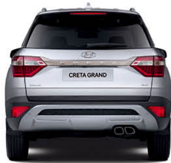
مداس العجلات 1,564.3