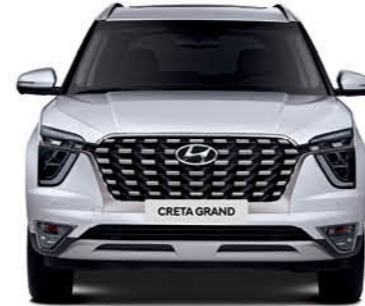
العرض الإجمالي 1,790 مداس العجلات 1,595.5