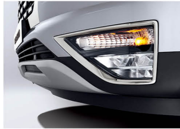
مصابيح ضباب أمامية (LED MFR)