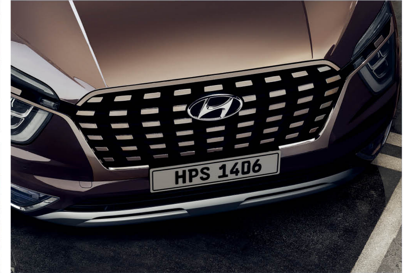
مصابيح أمامية LED مع مصابيح نهائية LED DRL عجلات معدنية بقصة الألماس مقاس 18 بوصة