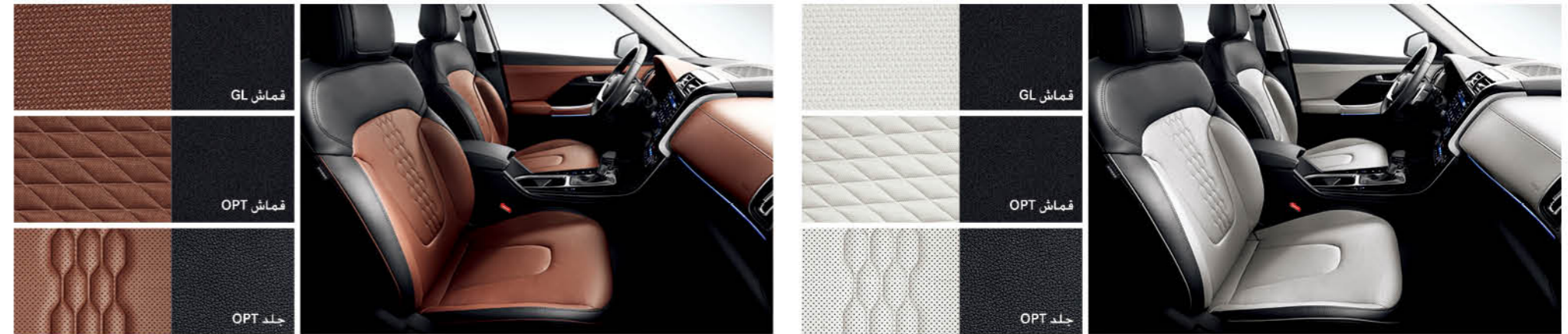
مقصورة باللونين الأسود / الرمادي