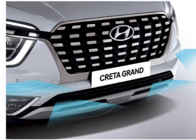
نظام تنبيه للمسافة الأمامية