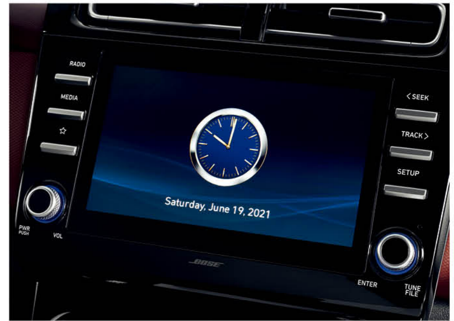
شاشة تعمل باللمس مقاس 8 بوصة