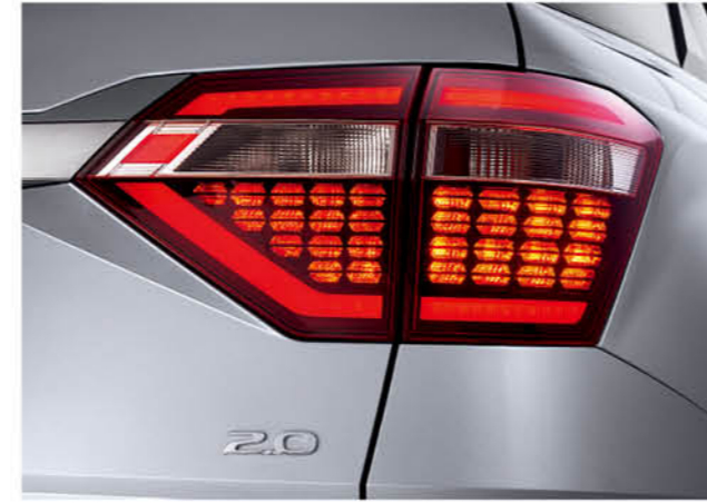
مجموعة مصابيح خلفية LED