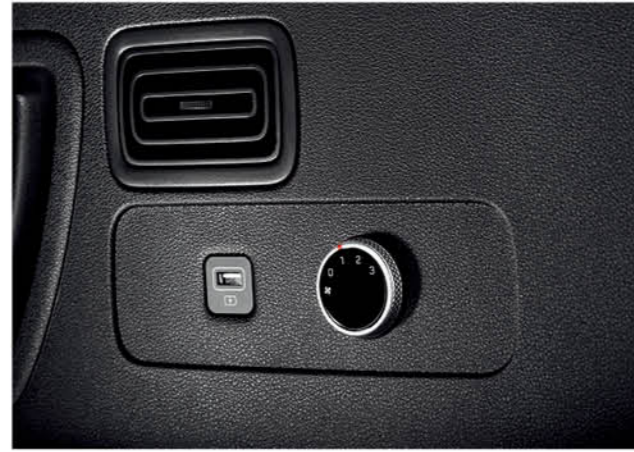
فتحات تهوية بالصف 3 وتحكم بالسرعة (3 مراحل)