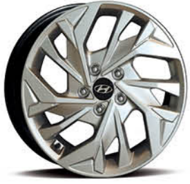
عجلات معدنية 18 بوصة