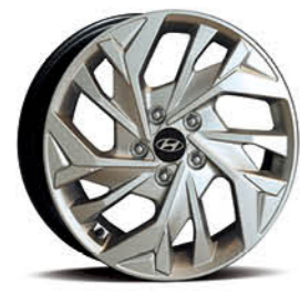
عجلات معدنية 17 بوصة