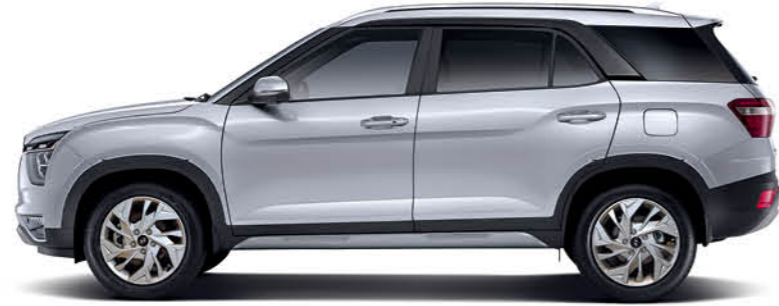
الطول الإجمالي 4,500 قاعدة العجلات 2,760

الارتفاع الإجمالي (يشمل الحاملة على السطح)