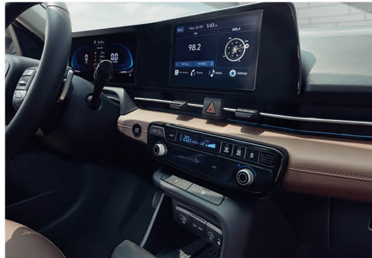
تحكم مزوج أونوماتيكي في درجة الحرارة ومقاعد أمامية متهواة