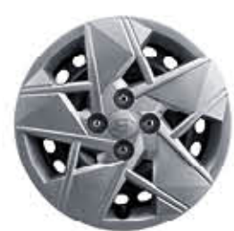
15 غطاء عجلة فولادي