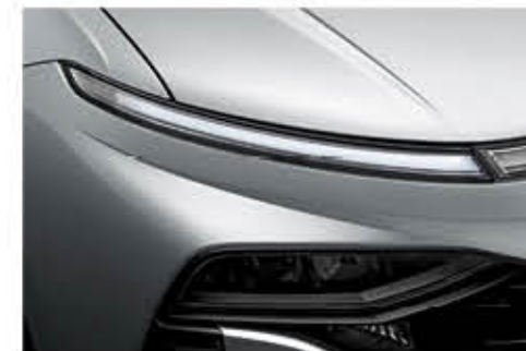
مصباح ليد للقيادة النهارية