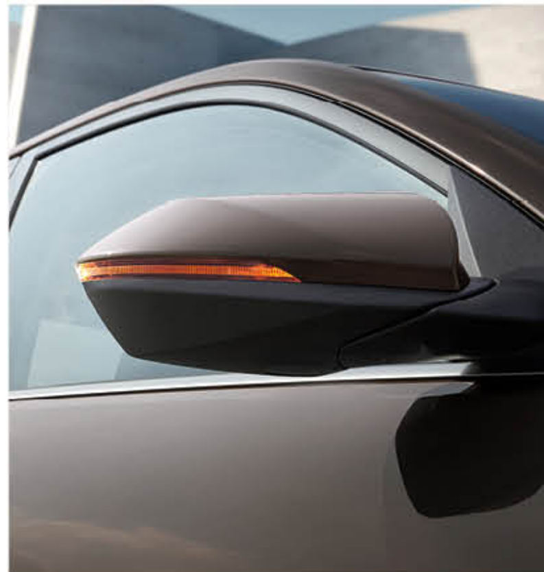
المرآيا الخارجية ومؤشرات تحويل الاتجاه