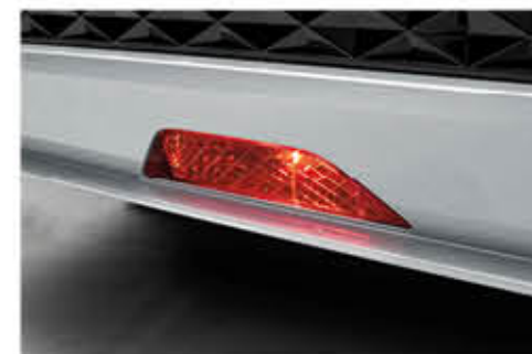
مصباح ضباب خلفي