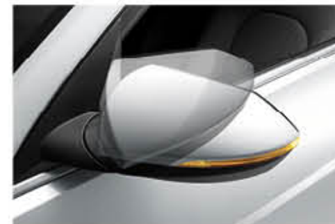
مصباح ليد لمؤشرات الانعطاف (OPT)