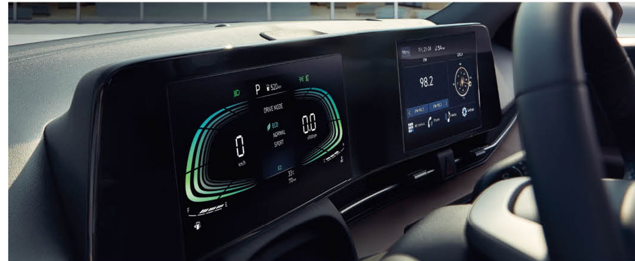
نظام صوتي للعرض مدمج ومجموعة عدادات رقمية