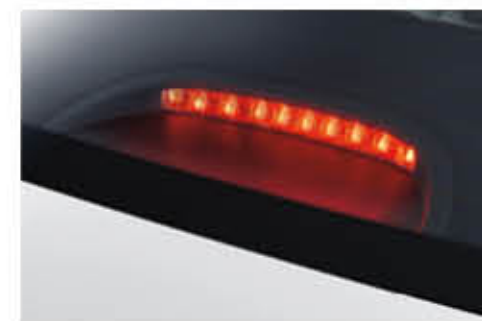
مصباح توقف ذو إضاءة عالية