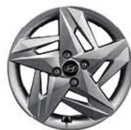
عجلات ألمنيوم مقاس 16 بوصة