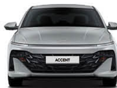
العرض الإجمالي 1,765