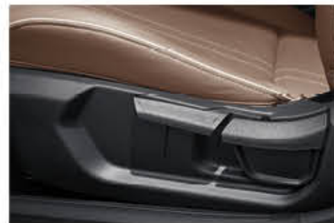
ذراع تحكم في ارتفاع مقعد السائق