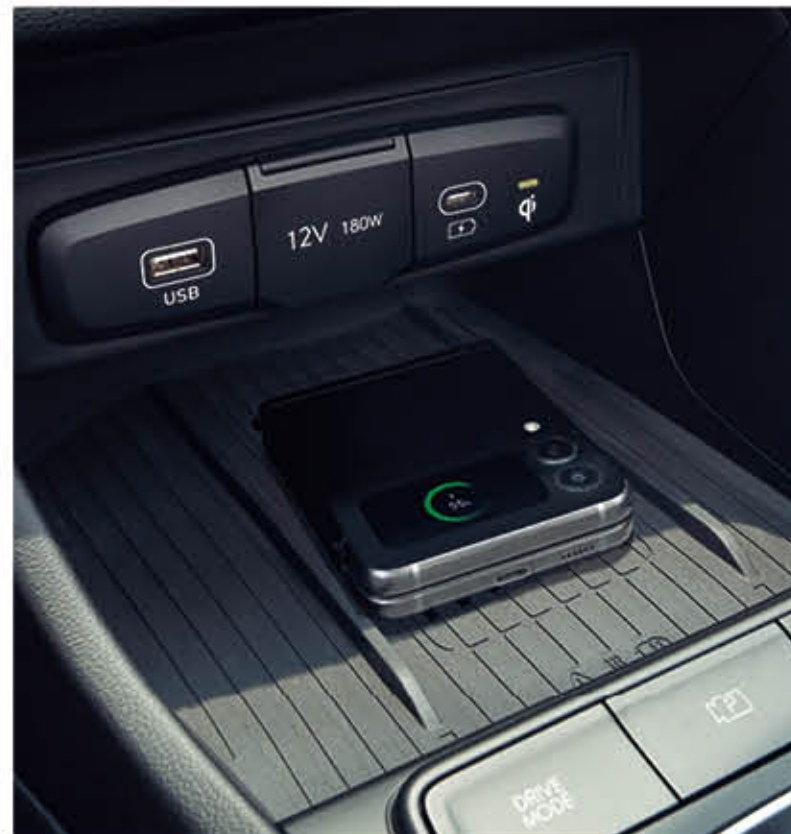
شاحن الهاتف اللاسلكي / شاحن أمامي من النوع C

اكتشف مفاجآت مبهجة مثل نظام التحكم بالوسائط المتعددة مقاس 8 بوصات ومصابيح الأجزاء المحيطة.