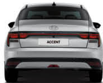
العرض الإجمالي 1,765