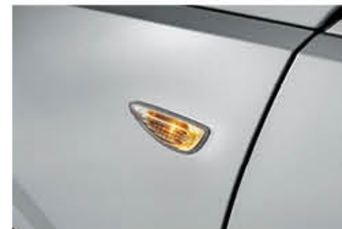
إشارة انعطاف على الجانب (من نوع اللمبة، STD)