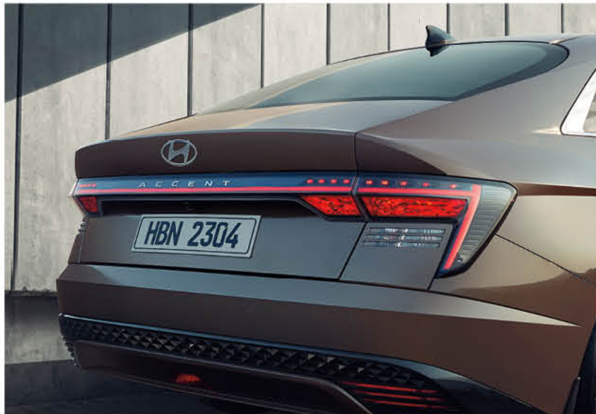
مجموعة المصابيح الخلفية ليد

في عالم تتشابه به سيارات السيدان، تبرز أكسنت الجديدة بمصباح الأفق المميز - وهو مصباح إضاءة فريد بعد علامة تميزها على الطريق. كما تضيف الشبكة الأمامية المطلية بالكروم الأسود والعجلات المعدنية المذهلة لمساة نهائية مثالية.