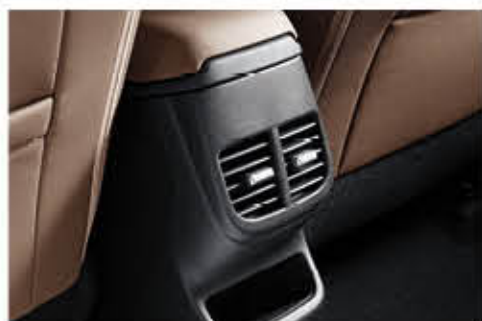
فتحة تهوية خلفي