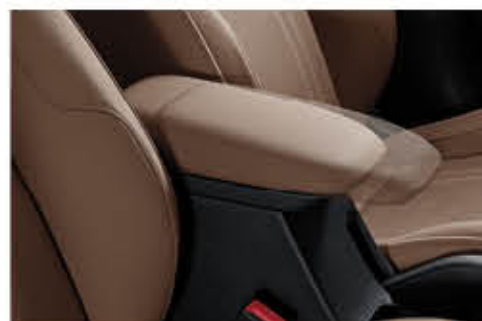
صندوق تحكم منزلق