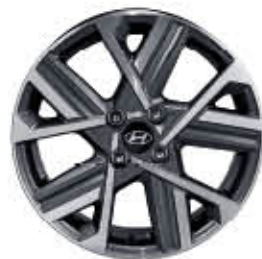
عجلات ألمنيوم من النوع B مقاس 16 بوصة