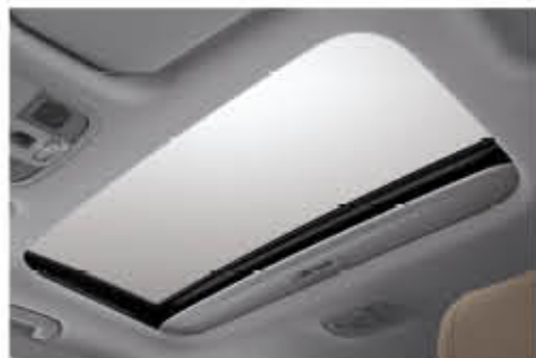
فتحة سقف كهربائي