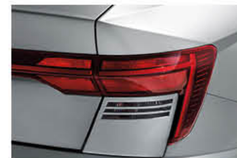
مجموعة مصابيح خلفية (من نوع اللمبة)