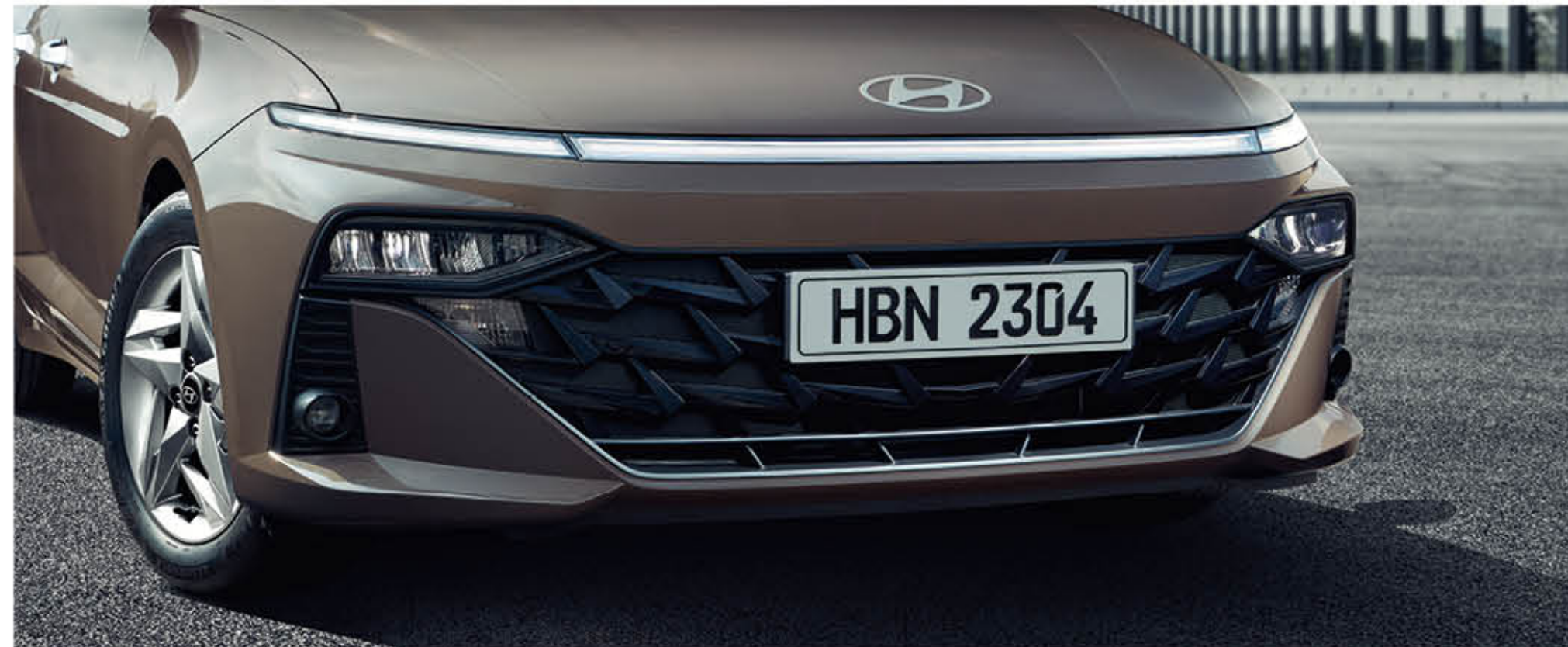
مصباح أفقي ليد / مصابيح أمامية ليد (ردار MFR متعدد الوظائف) / شبكة أمامية من الكروم الأسود