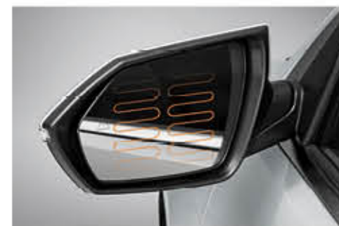
مرايا جانبية مزودة بمدفأة