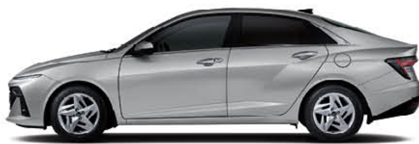
قاعدة العجلات 2,670 الطول الإجمالي 4,535