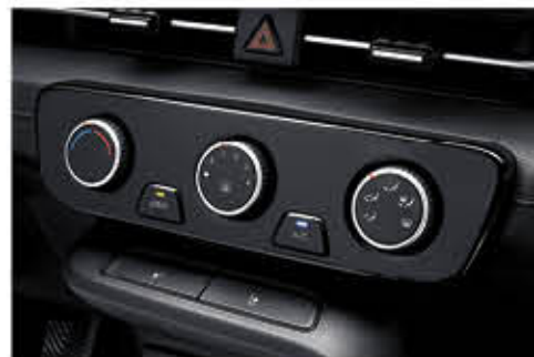
نظام تكييف الهواء يدوي