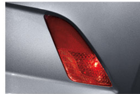
مصباح ضباب خلفية