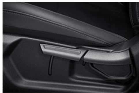
ضابط ارتفاع مقعد السائق