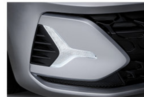
مصباح ليد للقيادة النهارية (دي آر إل)