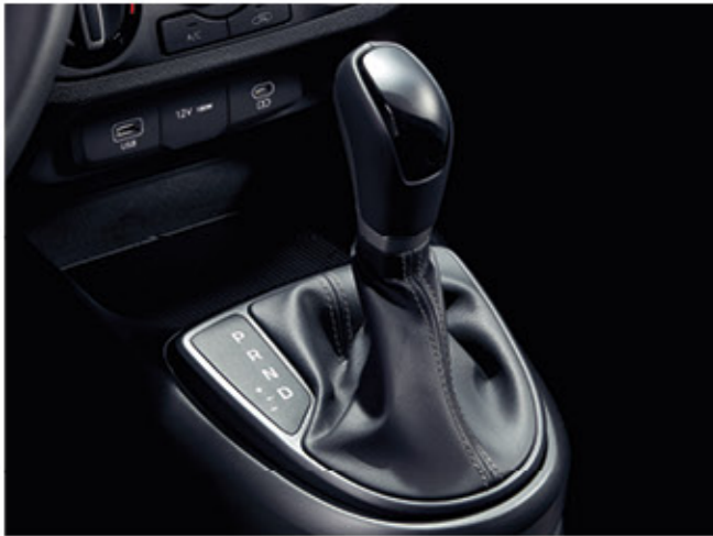
ناقل حركة أوتوماتيكي 4 سرعات

للسائقين الذين يطلبون أقصى قدر من الراحة ، تقدم هيونداي ناقل حركة أوتوماتيكي رباعي السرعات اختياري، موثوق به وهادئ وفعال.