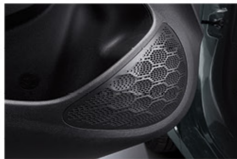
نظام مكبرات صوت أمامية / خلفية رباعي