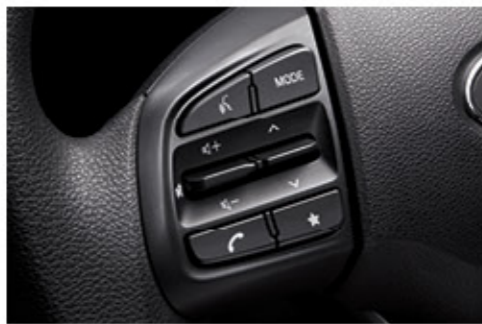
بلوتوث غير سلكي