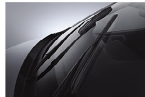
مشاحات زجاج نوعية Aero