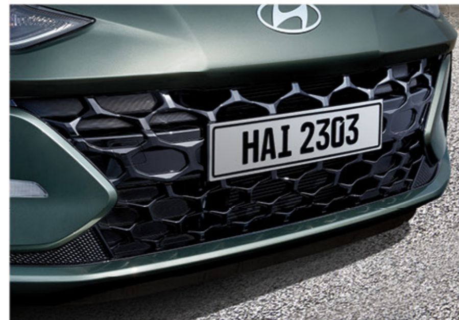
شبكة المبرد الأمامية باللون الأسود اللامع