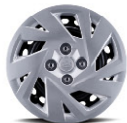
غطاء عجلة فولاذي مقاس 14 بوصة