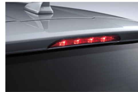
مصباح توقف ليد ذو إضاءة مرتفعة