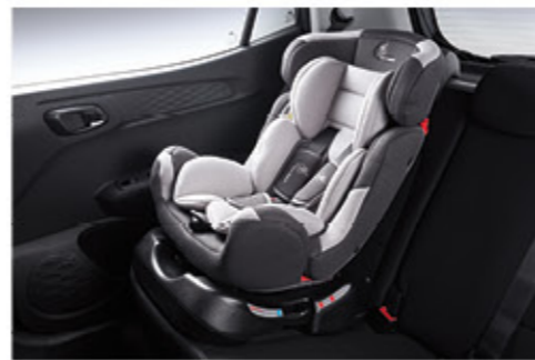
نظام مرساة الطفل