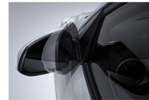
مرايا كهربائية قابلة للطي