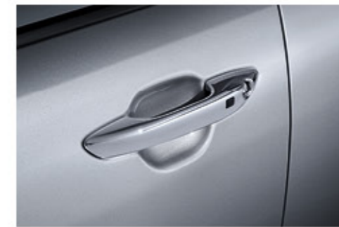
مقابض أبواب مطلية بالكروم