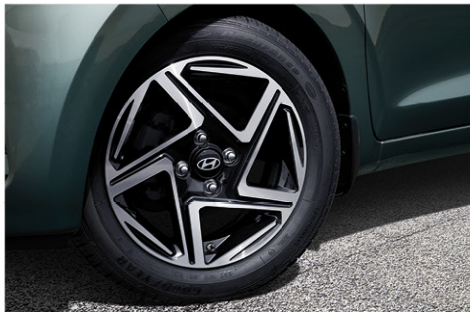
عجلات ألومنيوم مقاس 15 بوصة