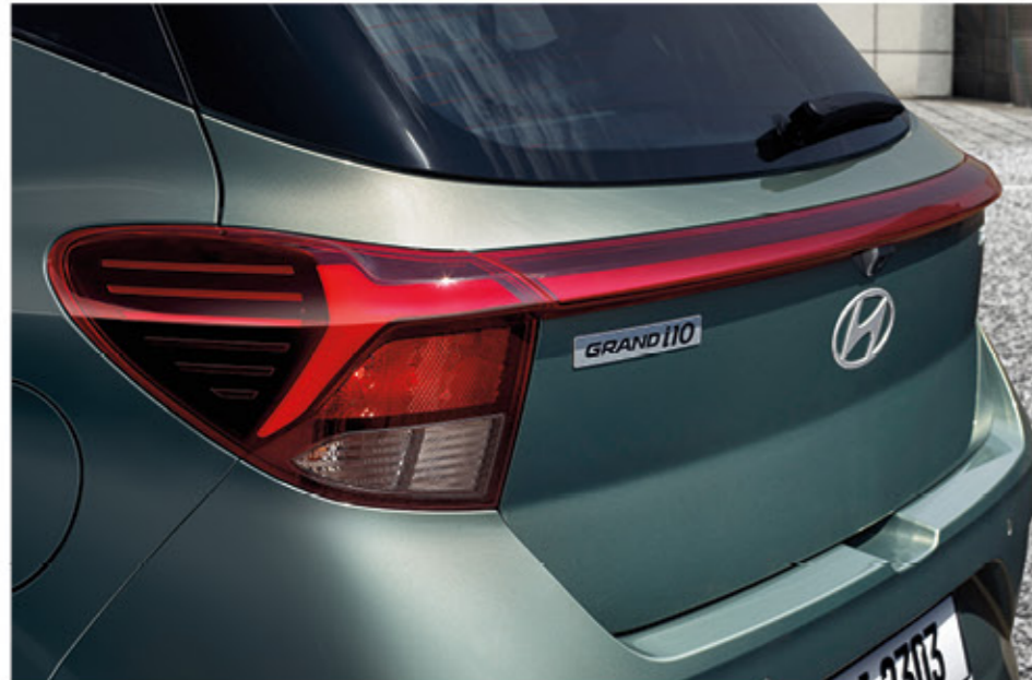
مصابيح خلفية ليد

تجعلك سيارة جراند آي ١٠ تبدأ في مغامرتك القادمة على الطريق بأسلوب جريء ومثير. بها كل التفاصيل التي تعزز متعة القيادة. تتميز بجنوط ألومنيوم مقاس ١٥ بوصة ذات مظهر مثير، وشبكة مبرد سوداء لامعة أكثر جرأة تخطف الأنظار. وتضفي مصابيح ليد لمسمة من التطور التكنولوجي العالي بينما تخلق معالجة الطلاء ذات اللونين مظهرًا عصريًا مميزًا.