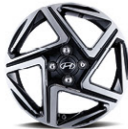
عجلات معدنية 15 بوصة