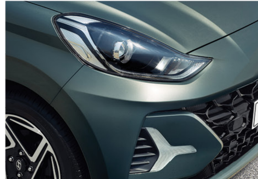
المصابيح الأمامية / مصابيح ليد للقيادة النهارية (دي آر إل)