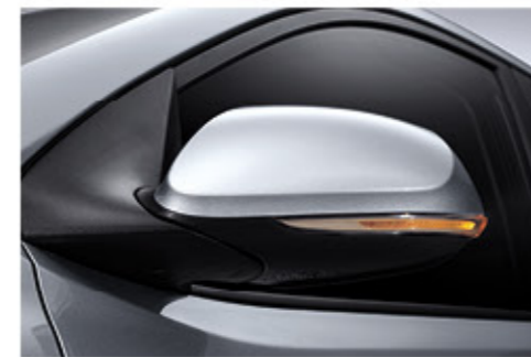
مرايا خارجية ومؤشرات اتجاهات