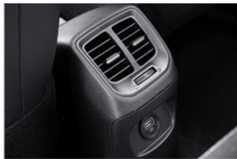
فتحات تكييف خلفية