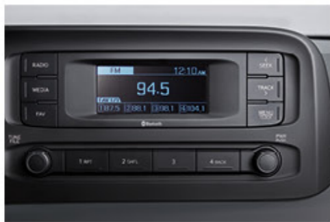
راديو + أري إس