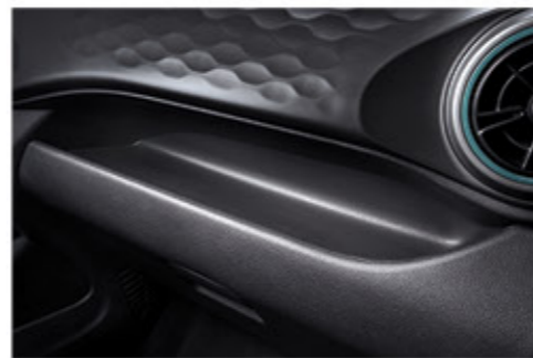
منطقة تخزين عملية