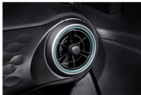
فتحات مكيف هواء فريدة من نوعها على شكل مروحة