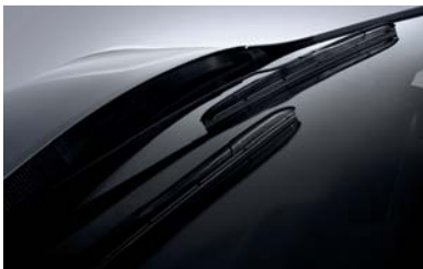
مساحات زجاج آيروديناميكية