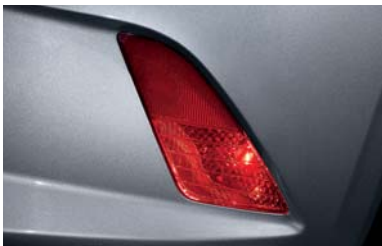
مصباح ضباب خلفية