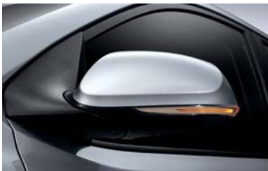
مصباح صغيرة بالمرآيا الخارجية