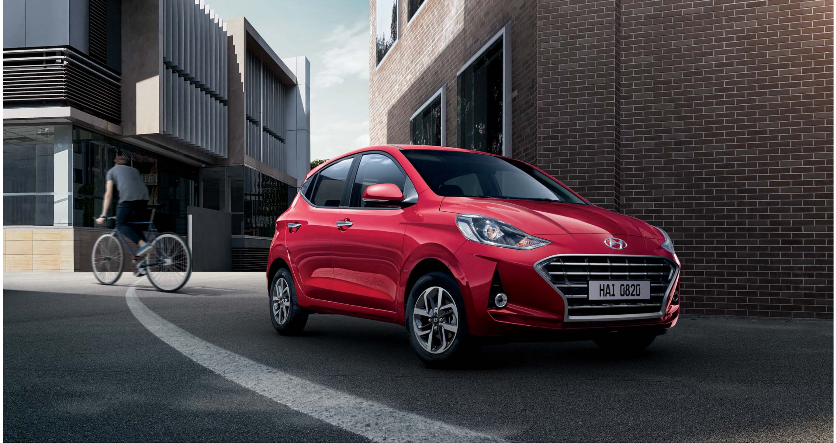
عجلات معدنية بقصة الألماس مقاس 15 بوصة