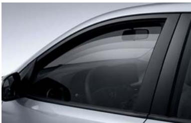
نوافذ تعمل كهربائياً