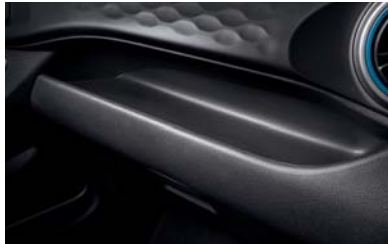
حيز تخزين عملي