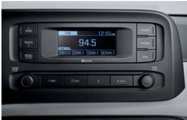
راديو + RDS