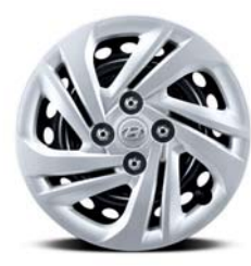
غطاء عجلة فولاذي مقاس 14 بوصة