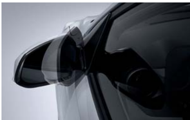
مرايا جانبية قابلة للطي كهربائياً