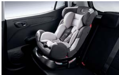
نظام تثبيت مقعد الطفل إيزوفيكس