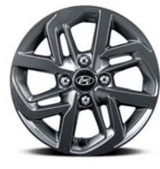
عجلات معدنية مقاس 14 بوصة