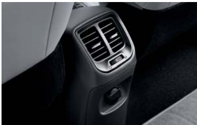
فتحات تكييف هوائي خلفي