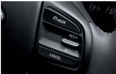
نظام تثبيت السرعة