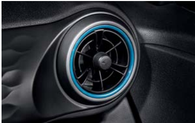
فتحات تهوية بموديل مروحة فريدة من نوعها