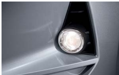
مصباح ضباب أمامية