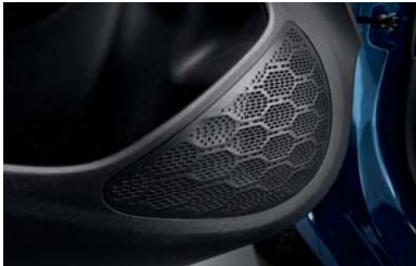
أربعة مكبرات صوت أمامية/خلفية