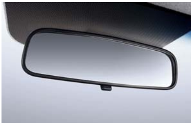
مرآة للمشاهدة الخلفية أثناء النهار والليل