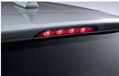
مصباح توقف علوي