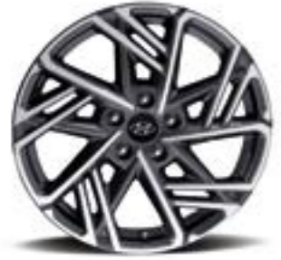
عجلة معدنية مقاس 18 بوصة