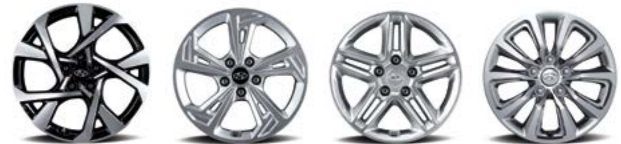
عجلة معدنية مقاس 18 بوصة