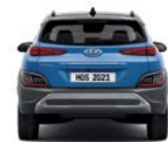
مداس العجلات* 1,568