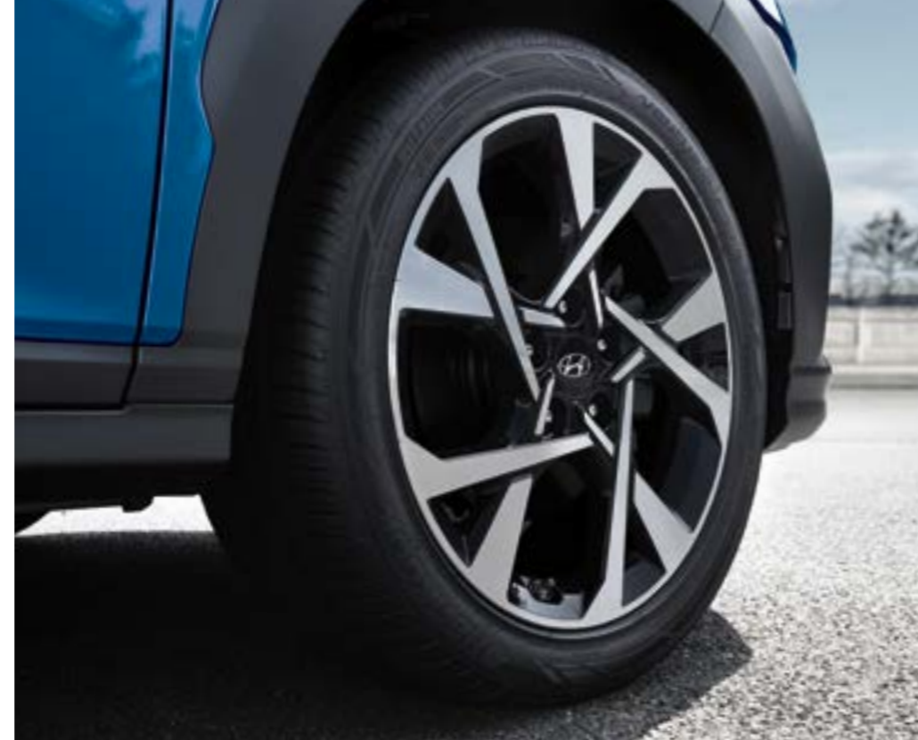
عجلات معدنية مقاس 18 بوصة