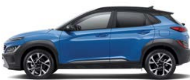
قاعدة العجلات 2,600