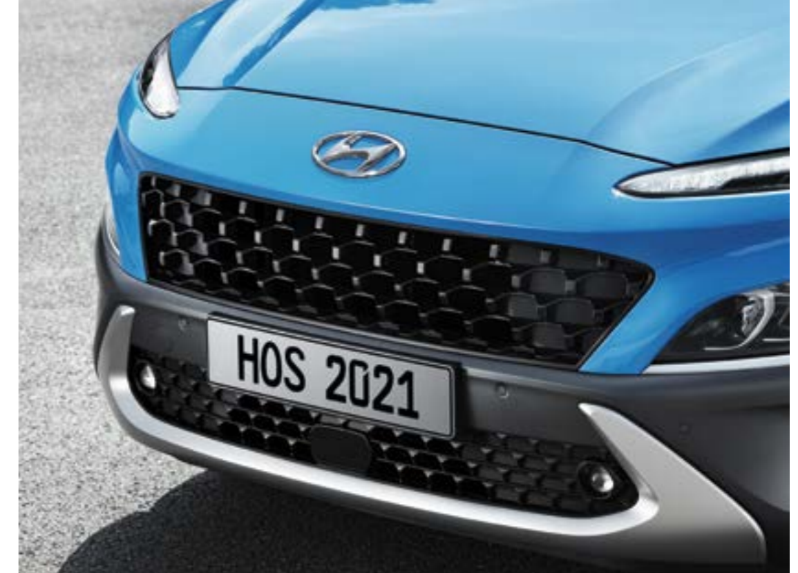
الواجهة الأمامية المنحوتة تعكس الطابع الرياضي الجريء