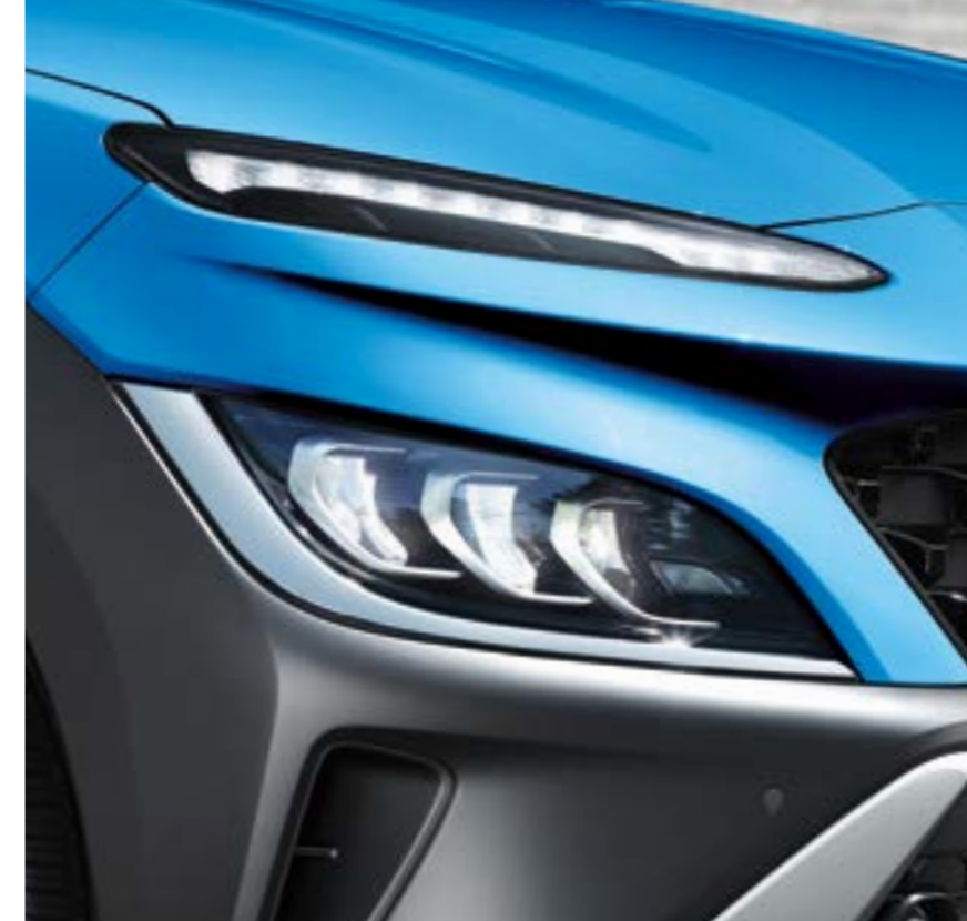
مصابيح خلفية LED ومصابيح نهارية LED متكررة (DRL)