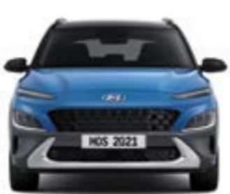
مداس العجلات* 1,559