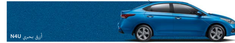
أزرق بحري N4U