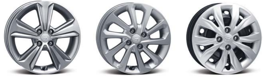
عجلات معدنية 16 بوصة