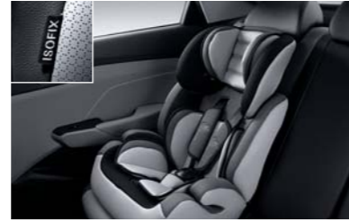
نظام تثبيت مقعد الطفل