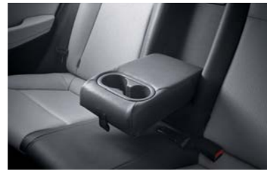
مسند يد في المقعد الخلفي