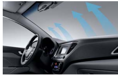
مزبل الضباب عن الزجاج