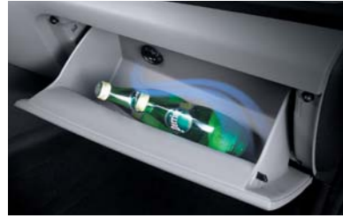
صندوق القفازات مع نظام تبريد