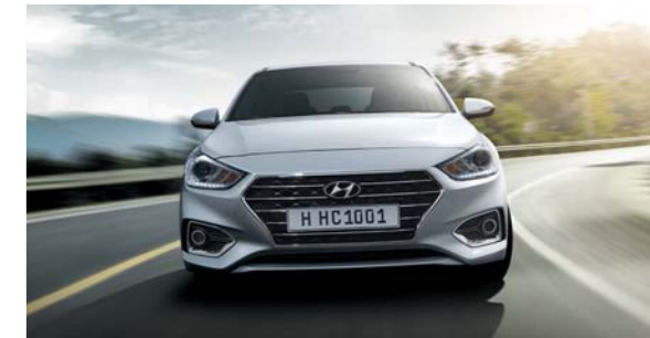
التحكم الإلكتروني بالثبات

يشكل التوقف والانطلاق على طريق شديدة الانحدار إرهاقاً للسائق، إضافة إلى خطورته الكبيرة، لذلك فإن نظام التحكم للمساعدة عند المرتفعات يعمل على استخدام المكابح على العجلات لمنع انزلاق أو تدحرج المركبة، مما يمنح مزيداً من السلامة والأمان.