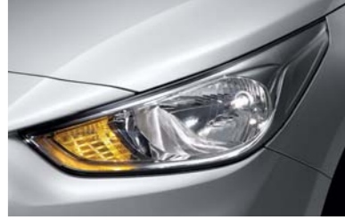
مصابيح هالوجين أمامية