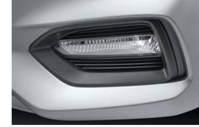
مصابيح نهائية بنظام اللمبات