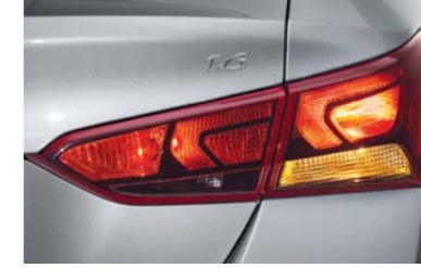
مصابيح خلفية بنظام اللمبات