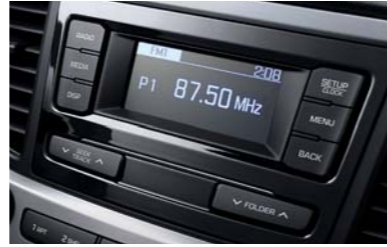
راديو + نظام صوتي RDS