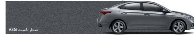
سنتار داسيت V3G