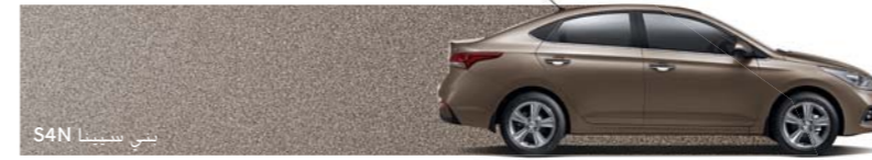
بني سيني٤ S4N