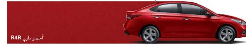
أحمر ناري R4R