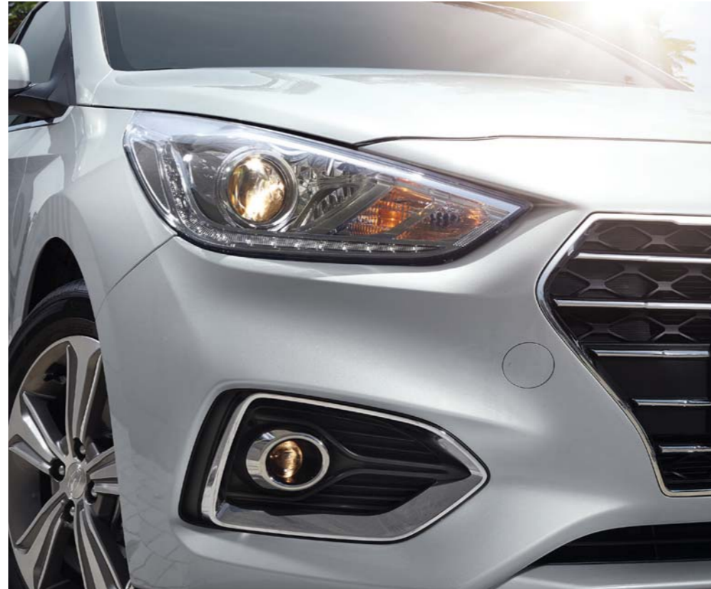
مصابيح أمامية عاكسة ومصابيح ضباب مركزة