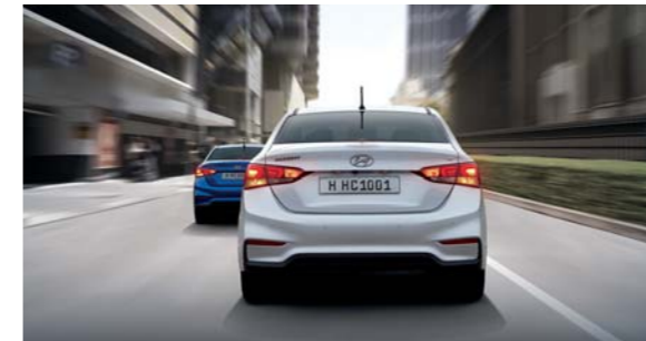
إشارة التوقف الطارئ

بفضل هذا النظام بإمكان السائق والراكب الأمامي الاستمتاع بحماية من كافة الجوانب وسلامة أكيدة، حيث تتوفر وسادتان هوائيتان أماميتان، بالإضافة إلى وسادتين ستارية جانبيتين على طول المقصورة توفر الحماية للراس. وبذلك يرتفع عدد الوسائد الإجمالي إلى ست وسائد.