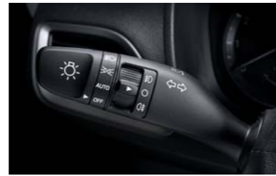
إشارة ثلاثية الوظائف تعمل بلمسة واحدة