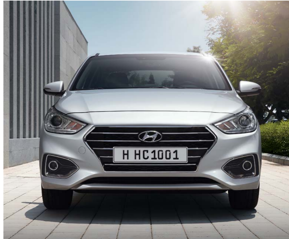
تصميم أمامي رياضي يحقق إنسيابية الهواء