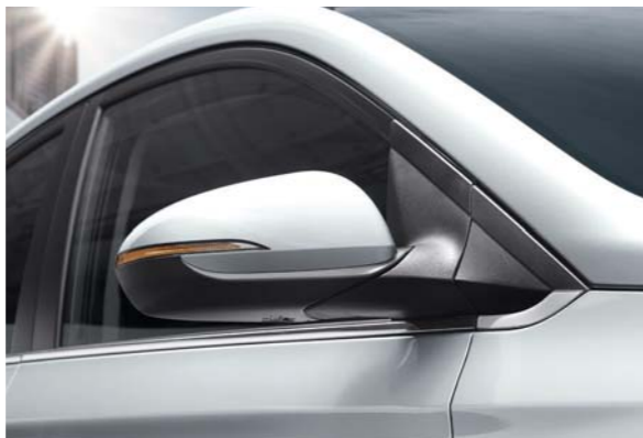
مجموعة مصابيح LED خلفية مرايا جانبية مع مصابيح صغيرة متتالية