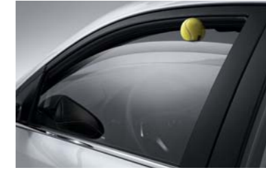
نوافذ بخاصية أمان