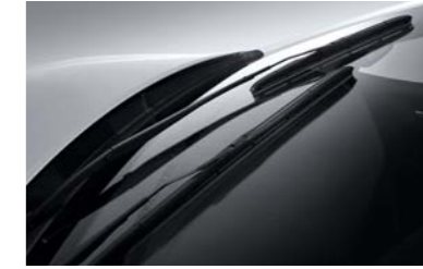
مساحات زجاج بتقنية Aero