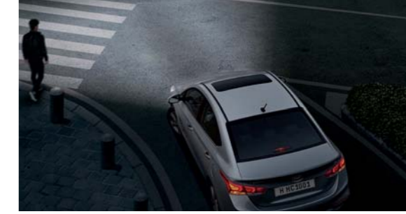
مصابيح الانحناء الثابتة

بإمكان السائق ضبط السرعة المطلوبة، وسوف تنقل الميزة تلقائياً. نظام التحكم في السرعة إلى المستوى التالي، من خلال الكبح تلقائياً ومنعه من تجاوز السرعة، وذلك لضمان مسافة آمنة بينه وبين السيارة التي أمامه.