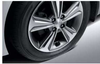
نظام مراقبة ضغط العجلات