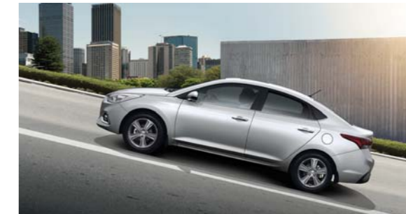
نظام تحكم للمساعدة عند المرتفعات

تعمل هذه الخاصية على التمييز بين عمليتي الكبح العادية أو الطارئة، فعند استخدام المكابح في الظروف المفاجئة والطارئة، سوف تبدأ مصابيح المكابح بالوميض تلقائياً، وبالتالي تعمل على تنبيه السائق إلى وجود وضع خطر أمامهم.