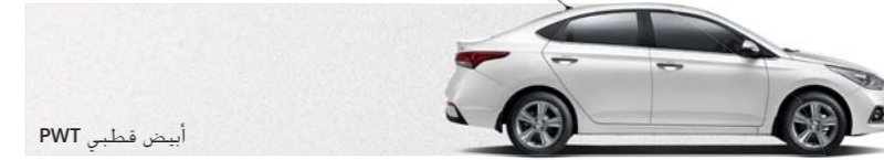
أبيض قطبي PWT