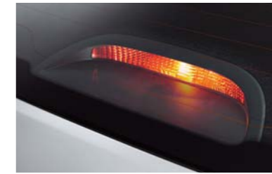
مصباح توقف مرتفع