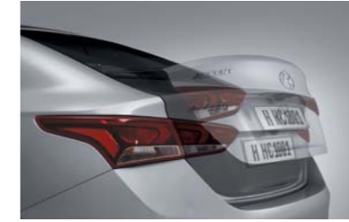
صندوق خلفي ذكي