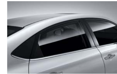
قوالب من الكروم المطور