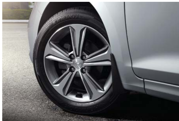
مصد خلفي بارز عجلات معدنية مقاس 16 بوصة