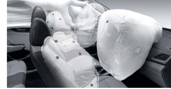
نظام من 6 وسائد هوائية

كشفت هيونداي عن ريادةها الابتكار في سيارتها NEOS-II موديل 2003، والذي يستخدم دوران عجلة القيادة لتشغيل وإطفاء مصابيح LED المساعدة، وبالتالي إضاءة المناطق الجانبية المظلمة التي تغطيها المصابيح الأمامية.