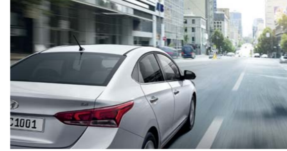
نظام تثبيت السرعة آلياً

فور دخولك سيارة أكسننت، سيغمرك شعور رائع بالحماية والأمان. لا شك أن هذا أكثر من مجرد شعور عابر، إنها حقيقة تكشف عنها هذه السيارة. بفضل تقنيات السلامة المتطورة المتوفرة في صناعة السيارات اليوم، توفر لك سيارة أكسننت أقصى درجات الحماية والسلامة.