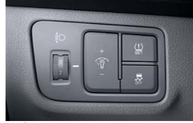
نظام كهربائي لنبات المركبة إلكترونياً