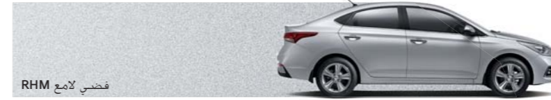
فضي لامع RHM