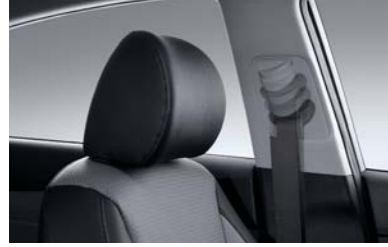
نظام تعديل ارتفاع حزام الأمان

لا مزيد من البحث عن مفتاح السيارة في جيوبك أو محفظتك. إذا كنت تحمل المفتاح معك، فإنه يتيح تشغيل السيارة وفتح الأبواب والصندوق الخلفي وإقفالها عن بعد.