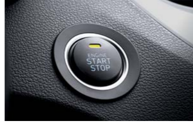
زر تشغيل يعمل بالدفع/المفتاح الذكي