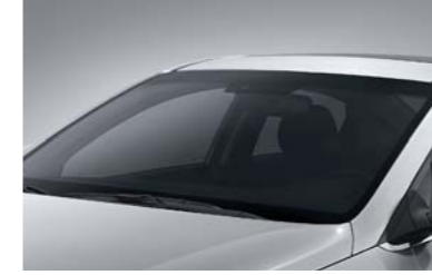
زجاج بخاصية الوقاية من أشعة الشمس