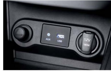
فتحات توصيل (USB/AUX)