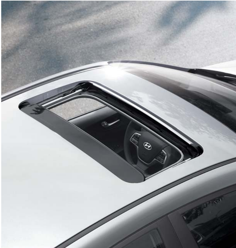
فتحة سقف كهربائية