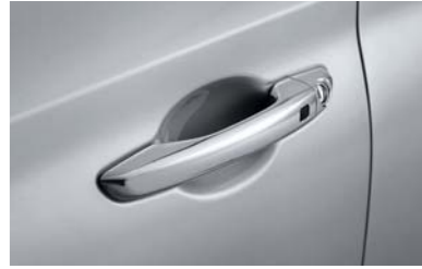
مقابض أبواب مطلية بالكروم