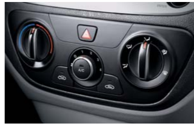
التحكم يدوياً بنظام التكييف