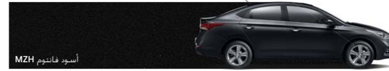
أسود فاننوم MZH