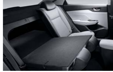
مقعد خلفي قابل للطي (بنسبة 40:60)