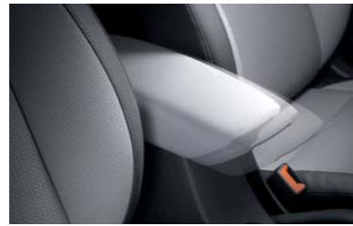
كونسول وسطي منزلق