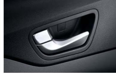
مقابض الأبواب الداخلية من الكروم