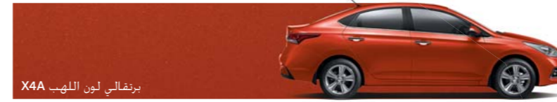
برتفالي لون الذهب X4A