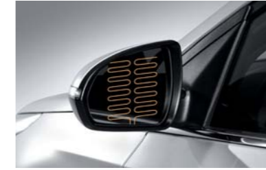
مرايا جانبية قابلة للتسخين