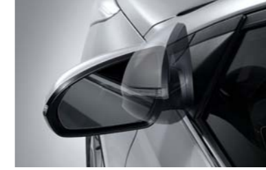
مرايا كهربائية قابلة للطي