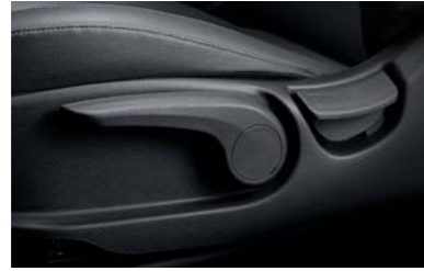
تعديل وضعية ارتفاع مقعد السائق