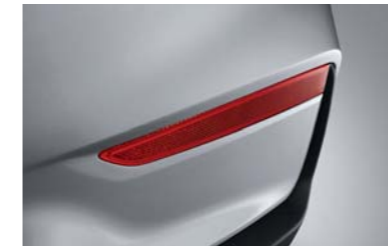
عاكس إنارة خلفي